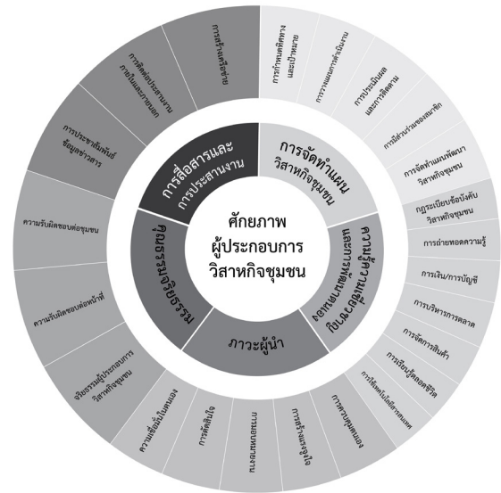
รูปที่ 1 (ร่าง) รูปแบบการพัฒนาศักยภาพผู้ประกอบการวิสาหกิจชุมชนในกลุ่มจังหวัดภาคกลาง (ครั้งที่ 1)

3.3.2 ผลการวิเคราะห์ข้อมูลเกี่ยวกับระดับความเหมาะสมของ (ร่าง) รูปแบบการพัฒนาศักยภาพผู้ประกอบการวิสาหกิจชุมชนในกลุ่มจังหวัดภาคกลางของผู้เชี่ยวชาญ/ประธานวิสาหกิจชุมชนในกลุ่มจังหวัดภาคกลางตรวจสอบ (ร่าง) รูปแบบการพัฒนาศักยภาพผู้ประกอบการวิสาหกิจชุมชนในกลุ่มจังหวัดภาคกลาง โดยการตอบแบบประเมิน 120 คน โดยภาพรวมและรายด้านปรากฏผลดังตารางที่ 2