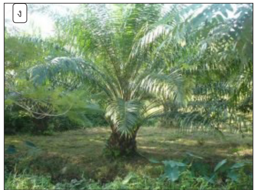
รูปที่ 1 ปาล์มน้ำมันที่ใช้ในการศึกษา (ก) ปาล์มน้ำมันอายุ 2 ปี ในพื้นที่นาร้าง (ข) ปาล์มน้ำมันอายุ 4 ปี ในพื้นที่นาร้าง (ค) ปาล์มน้ำมันอายุ 2 ปี ในพื้นที่เหมาะสม (ง) ปาล์มน้ำมันอายุ 4 ปี ในพื้นที่เหมาะสม

(Completely Randomized Design: CRD) [11] และเปรียบเทียบค่าเฉลี่ยโดยวิธี T-test