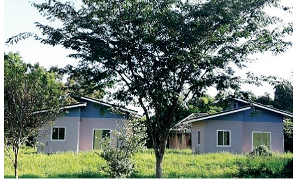
รูปที่ 1 บ้านพักอาศัยต้นแบบ (ถ่ายจากสถานที่จริง)

งานวิจัยนี้มีจุดประสงค์เพื่อวิเคราะห์ปริมาณก๊าซเรือนกระจกที่เกิดขึ้นจากการก่อสร้างบ้านพักอาศัยต้นแบบ