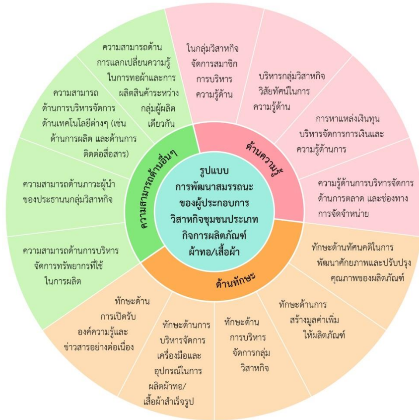
รูปที่ 3 รูปแบบการพัฒนาสมรรถนะของผู้ประกอบการวิสาหกิจชุมชนประเภทกิจการผลิตภัณฑ์ผ้าทอในประเทศไทย

คัดเลือกพนักงาน 2) ความรู้ด้านวิสัยทัศน์ในการบริหาร กลุ่มวิสาหกิจ 3) ความรู้ด้านการบริหารจัดการการเงิน และการหาแหล่งเงินทุน และ 4) ความรู้ด้านการบริหารจัดการด้านการตลาดและช่องทางการจัดจำหน่าย ซึ่งสอดคล้องกับ งานวิจัยของธงพล และ อุทิศ [5] ได้ทำการ ศึกษาแนวทางการพัฒนา การดำเนินงานของวิสาหกิจ ชุมชนในเขตลุ่มทะเลสาบสงขลา โดยแนวทางการพัฒนา การดำเนินงานของวิสาหกิจชุมชนหน่วยงานภาครัฐเป็น หน่วยงานสำคัญของการพัฒนาวิสาหกิจชุมชน ทั้งในด้าน การให้ความรู้ การพัฒนาทักษะด้านต่าง ๆ การสนับสนุน ด้านการตลาด และการกำหนดระเบียบต่าง ๆ เพื่อสนับสนุน วิสาหกิจชุมชน