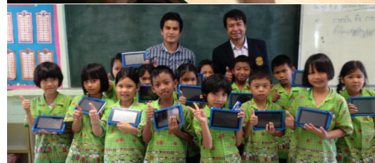
รูปที่ 2 การดำเนินการทดลองและการเก็บข้อมูล