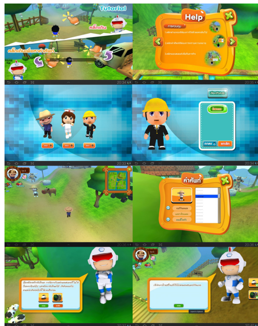
รูปที่ 1 ตัวอย่างแอปพลิเคชันเกมสามมิติประเภทสวมบทบาทเพื่อพัฒนาทักษะการเรียนรู้คำศัพท์ภาษาอังกฤษ

5.1 การสร้างแอปพลิเคชัน เครื่องมือที่ใช้ในการดำเนินงานในการออกแบบและการพัฒนาแอปพลิเคชัน โดยองค์ประกอบสำคัญของเกมคอมพิวเตอร์เพื่อการศึกษา ได้แก่ เป้าหมาย กฎ กติกา การแข่งขัน ความท้าทาย จินตนาการ ความปลอดภัย และความสนุกสนาน เพลิดเพลิน [8]