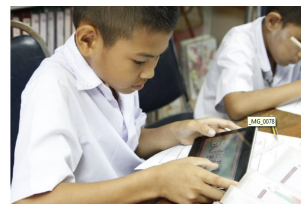
รูปที่ 1 แสดงภาพขณะนักเรียนทำการทดลองใช้

จากตารางที่ 4 แสดงความพึงพอใจของผู้เรียนที่มีต่อแอปพลิเคชันบนแท็บเล็ตสำหรับนักเรียนที่มีความบกพร่องทางการเรียนรู้ด้านคณิตศาสตร์ จำนวน 5 คน ผลการวิจัยพบว่า ผู้ตอบแบบสอบถามมีความพึงพอใจในระดับมากที่สุด โดยมีค่าเฉลี่ยรวม 4.70 พึงพอใจระดับมากที่สุดในด้านรูปแบบและภาพลักษณ์ ค่าเฉลี่ย 4.80 ด้านการใช้งาน ค่าเฉลี่ย 4.72 ด้านกระบวนการติดตั้งและความเข้าใจในการใช้งานแอปพลิเคชัน ค่าเฉลี่ย 4.66 และด้านภาพรวมของแอปพลิเคชันค่าเฉลี่ย 4.65 ตามลำดับ