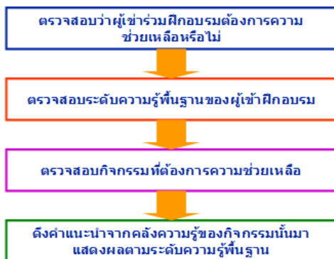
รูปที่ 1 การทำงานของเอเจนต์ให้คำแนะนำ

4. ระบบที่ปรึกษา (Counseling Component) ให้คำปรึกษากับผู้เข้าฝึกอบรมโดยใช้เทคนิคของคอมพิวเตอร์เอเจนต์ในการทำงาน แบ่งออกเป็นเอเจนต์ให้คำแนะนำ (Guidance Agent) ทำหน้าที่ให้คำแนะนำหรือคำถามขึ้นที่เหมาะสมกับระดับความรู้พื้นฐานของผู้เข้าฝึกอบรมขณะทำกิจกรรมแก้ไขปัญหาหากผู้เข้าฝึกอบรมต้องการความช่วยเหลือ และเอเจนต์ตรวจสอบการทำกิจกรรม (Activity Monitoring Agent) ทำหน้าที่ตรวจสอบการเข้าฝึกอบรมและการทำกิจกรรมของผู้เข้าฝึกอบรมโดยแบ่งการตรวจสอบออกเป็น 2 ด้านได้แก่ การตรวจสอบการเข้าร่วมทำกิจกรรมของผู้เข้าฝึกอบรม และการตรวจสอบระยะเวลาที่ใช้ในการทำกิจกรรม