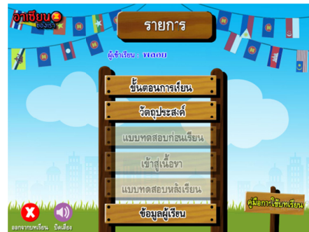
รูปที่ 2 หน้ารายการตอนเข้าสู่บทเรียนครั้งแรก

ทุกหน้าของบทเรียน แก้ไขภาพประกอบให้สอดคล้องกับเนื้อหา ปรับปรุงการปรากฏของภาพเคลื่อนไหวให้สอดคล้องกับเสียงบรรยาย และเพื่อให้ลำดับขั้นตอนการเรียนเป็นไปอย่างถูกต้อง ควรลือคูปุมเมนูในหน้ารายการเพื่อให้นักเรียนไม่เรียนข้ามขั้นตอนของคอมพิวเตอร์ช่วยสอน และลงมือแก้ไขตามคำแนะนำ ได้บทเรียนทั้งหมด 2 บท จำนวน 8 เรื่อง มีแบบฝึกหัดทั้ง 2 บทเรียนแบบทดสอบก่อนเรียน และแบบทดสอบหลังเรียน