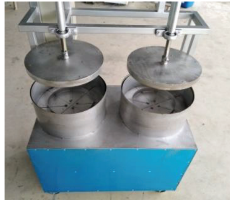
รูปที่ 2 เครื่องนวดผลมะนาว

6.6 ปรับปรุงแก้ไขข้อบกพร่องในการออกแบบตาม que ผู้เชี่ยวชาญแนะนำ เมื่อดำเนินการออกแบบครบทุกขั้นตอนแล้ว คณะผู้วิจัยได้ทำการตรวจสอบความถูกต้องแต่ละส่วนอีกครั้งและทำการประกอบ ติดตั้งเข้าด้วยกัน ดังแสดงในรูปที่ 2