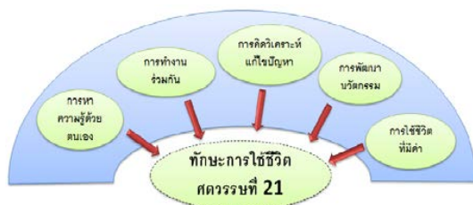
รูปที่ 3 ทักษะการใช้ชีวิตในศตวรรษที่ 21 ปรับปรุงจาก [3]

เมื่อมีชีวิตเกิดขึ้นสิ่งต่อไปคือการมีชีวิตอยู่รอดได้อย่างไร ทักษะในการใช้ชีวิตควรเป็นเช่นใดจึงจะสามารถตอบสนองวิถีชีวิต (Life style) ของตนได้อย่างลงตัว ไม่ว่าจะในอดีต ปัจจุบัน หรืออนาคต ในโลกยุคใหม่มีผู้เสนอทักษะในการดำเนินชีวิต [3]