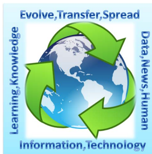
รูปที่ 1 สังคมโลกของการเปลี่ยนแปลง

ความรู้อื่น ทฤษฎีอื่นต้องทบทวนและทำความเข้าใจกันใหม่ว่าทราบใดที่โลกหมุนไปองค์ความรู้ต่าง ๆ ก็จะหมุนตาม มีการเพิ่มเติม มีการหักล้าง มีการเผยแพร่ไม่มีการหยุดนิ่ง เหมือนโลกใบนี้ได้เปลี่ยนเป็นสังคมโลกแห่งการเรียนรู้ โลกของการแบ่งปัน สังคม ประเทศชาติ ประชาชน จะต้องหมุนตามก้าวให้ทัน หากช้าไม่ติดตามก็จะล้าหลังอย่างรวดเร็วเช่นกัน ความเปลี่ยนแปลงที่เกิดขึ้นต่าง ๆ นานา ในปัจจุบันความเป็นไปของโลกใบนี้อาจแทนดังรูปที่ 1