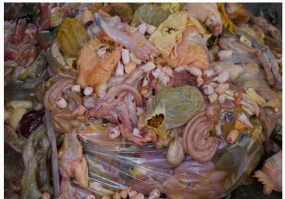
(ข) เศษชิ้นส่วนเนื้อสัตว์