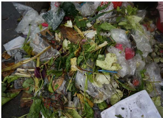
(ก) เศษผัก เศษผลไม้ และอื่นๆ

ที่ไม่เหมาะสม และการรักษาความสด และความสะอาดของสินค้าไม่สามารถคงความสดไว้ได้นาน จึงส่งผลให้เกิดของเหลือทิ้งจากการจำหน่ายสินค้าจำนวนมาก เฉลี่ยวันละ 2 ตัน สินค้าที่เน่าเสีย เสื่อมคุณภาพ ตลอดจนบรรจุภัณฑ์ที่ใส่สินค้า หรือเศษวัสดุจากการชำแหละเนื้อสัตว์และสัตว์ทะเล จึงต้องมีระบบการเก็บรวบรวมที่ดีและมีประสิทธิภาพ มูลฝอยจากตลาดสดแสดงในรูปที่ 1 (ก) เศษผัก เศษผลไม้ และ (ข) เศษชิ้นส่วนเนื้อสัตว์