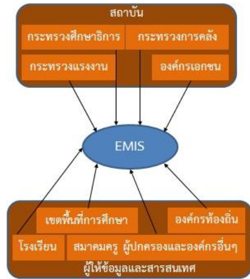
ภาพที่ 1 การเชื่อมโยงระบบสารสนเทศทางการศึกษากับองค์กรต่างๆ [9]

กับองค์กรภาครัฐ และองค์กรเอกชน เช่น โรงเรียน ครอบครัวยุโรปไปถึงสมาคมครู และผู้ประกอบการด้วย ดังภาพที่ 1