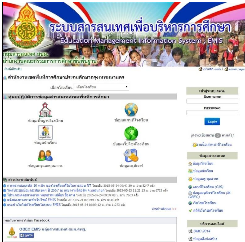
ภาพที่ 3 แสดงลักษณะระบบสารสนเทศเพื่อบริหารการศึกษาของสำนักงานคณะกรรมการการศึกษาขั้นพื้นฐาน (สพฐ.)

ระบบ EMIS ของกระทรวงศึกษาธิการดังกล่าวนี้เป็นอีกก้าวสำคัญของการจัดการระบบสารสนเทศของสำนักงานคณะกรรมการการศึกษาขั้นพื้นฐาน หรือ สพฐ. ที่ทำหน้าที่บริหารจัดการศึกษาในระดับชั้นอนุบาลจนถึงระดับมัธยมศึกษา โรงเรียนแต่ละระดับมีจำนวนมากกระจายอยู่ทั่วประเทศ แต่ละโรงเรียนประกอบด้วยอาคาร สถานที่ นักเรียน ครู บุคลากรทางการศึกษา เจ้าหน้าที่ วัสดุ ครุภัณฑ์ และข้อมูลอื่นๆ อีกมากมายที่ถูกจัดเก็บไว้ภายในโรงเรียน ด้วยข้อมูลที่มีอยู่จำนวนมากมายมหาศาลเช่นนี้ ข้อมูลส่วนถูกจัดเก็บไว้ภายในแต่ละโรงเรียน บางส่วนจัดเก็บไว้ที่สำนักงานเขตพื้นที่การศึกษา หรือบางส่วนอาจถูกจัดเก็บไว้ที่กระทรวงศึกษาธิการ หรือหน่วยงานอื่นๆ ที่เกี่ยวข้อง และมีความเป็นไปได้สูงที่ข้อมูลบางส่วนอาจถูกจัดเก็บซ้ำซ้อนกัน มีการประมวลผลที่ซ้ำกัน