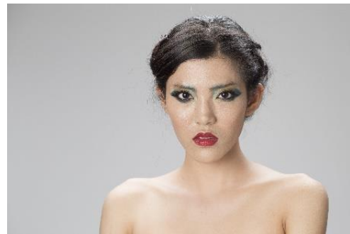
ภาพที่ 9 ภาพแนวการแต่งหน้าแบบแฟนตาซี (Fantasy) นางแบบผิวขาวเหลือง

จากผลการศึกษา การจัดแสงถ่ายภาพบุคคลแนวการแต่งหน้าแบบแฟนตาซี (Fantasy) นางแบบผิวขาวเหลือง ควรใช้สีของอายแชโดว์ที่มีสีโทนเข้มเพื่อให้เฉดสีเด่นชัดมากที่สุด และเนื่องด้วยโครงหน้าของนางแบบ มีโครงหน้าที่มีส่วนเหลี่ยม ลักษณะของตาคมได้รูป ทางผู้จัดทำจึงนำเสนอการลงอายแชโดว์เป็นแบบลาย กราฟิค มีส่วนตัดกันของสีที่ชัดเจน การกรีดตาที่คมเหมาะสมกับลักษณะของดวงตาทำให้ตาดูเป็นจุดเด่นยิ่งขึ้น เมื่อถ่ายภาพออกมาเฉดสีของอายแชโดว์กระทบกับแสงไฟ เฉดสีอ่อนจะมีสีที่ซีดจางลงมาก ส่วนเฉดสีเข้มจะมีสีที่พอดิบกับสีผิว