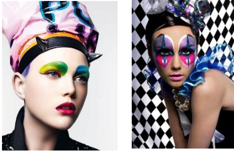
ภาพที่ 6 ภาพอ้างอิงการแต่งหน้าแบบแฟนตาซี