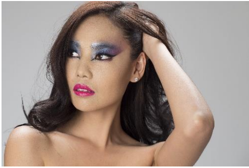
ภาพที่ 10 ภาพแนวการแต่งหน้าแบบแฟนตาซี (Fantasy) นางแบบผิวขาวชมพู

จากผลการศึกษา การจัดแสงถ่ายภาพบุคคลแนวการแต่งหน้าแบบแฟนตาซี (Fantasy) นางแบบผิวแทนหรือผิวสีน้ำผึ้งผลการศึกษา พบว่า เป็นผิวที่ได้รับความนิยม เป็นสีผิวที่ดูแล้วมีเสน่ห์ มีความเช่กซึ่ในสีผิว ความจริงแล้วผิวแทนหรือผิวสีน้ำผึ้งเหมาะกับการแต่งหน้าใช้โทนสีร้อน เช่น ทอง เหลือง แดง ส้ม และส้มอมน้ำตาล ตามคำแนะนำของผู้เชี่ยวชาญด้านการแต่งหน้า แต่ทางผู้จัดทำอยากลองนำเสนอการใช้สีโทนเย็นกับนางแบบผิวแทนหรือผิวสีน้ำผึ้ง ผลที่ออกมาคือโทนสีของอายแชโดว์ที่ลงไปบนเปลือกตามีความเข้มเพิ่มขึ้นกว่าความเป็นจริง ทำให้ยากต่อการควบคุมน้ำหนักการลงสี