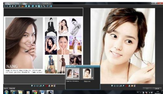
ภาพที่ 3 ภาพขั้นตอนการเลือกนางแบบตามสีผิว (ผิวขาว)