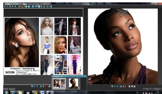
ภาพที่ 5 ภาพขั้นตอนการเลือกนางแบบตามสีผิว (ผิวดำหรือผิวกล้า)