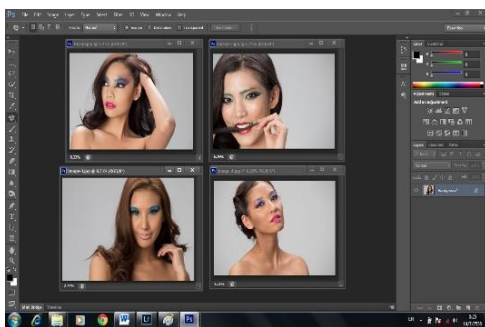
ภาพที่ 8 ภาพขั้นตอนการวาง Layout