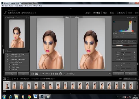
ภาพที่ 7 ภาพขั้นตอนการแปลงไฟล์

3.11 นำแบบประเมินกลับมาวิเคราะห์ สรุปผลการศึกษาและทำการอภิปราย