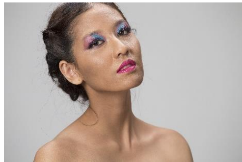
ภาพที่ 12 ภาพแนวการแต่งหน้าแบบแฟนตาซี (Fantasy) นางแบบผิวดำหรือคล้ำ

น้ำตาลอ่อน น้ำตาลแดง ส้มน้ำตาล สีแดงอมเทา คือให้มีโทนสีร้อนแต่ผสมสีเทาหรือดำเข้าไปให้กลมกลืนบ้างจะทำให้เหมาะกับสีผิวมากขึ้น แต่ในการศึกษาครั้งที่ทางผู้จัดทำพบปัญหาคือไม่สามารถจัดหานางแบบผิวดำหรือคล้ำมาได้ ทางผู้จัดทำจึงแก้ปัญหาด้วยวิธีคือ ใช้นางแบบผิวสีแทนหรือผิวสีน้ำผึ้งมาลงรองพื้นสีเข้ม เพื่อให้มีสีผิวสีเข้มขึ้นกว่าปกติ และเมื่อถ่ายภาพออกมาสีของรองพื้นที่ลงไปไม่ให้ผลที่เหมือนกับนางแบบผิวดำหรือคล้ำสีของรองพื้นไม่มีความเข้มที่เหมือนกับสีผิวจริง [5]