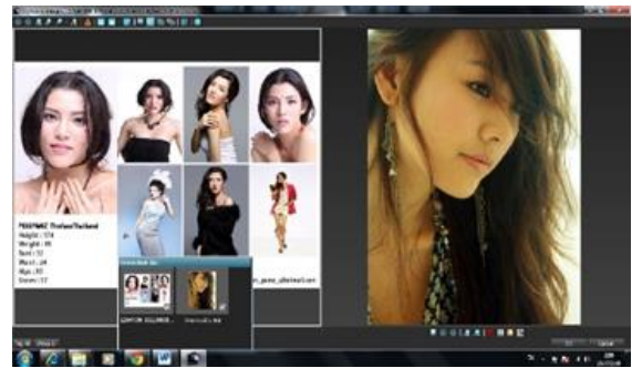
ภาพที่ 2 ภาพขั้นตอนการเลือกนางแบบตามสีผิว (ผิวขาวเหลือง)