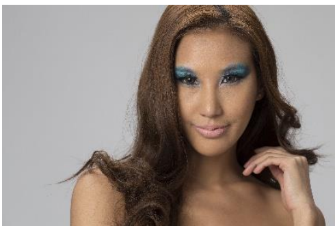
ภาพที่ 11 ภาพแนวการแต่งหน้าแบบแฟนตาซี (Fantasy) นางแบบผิวแทนหรือผิวสีน้ำผึ้ง

จากผลการศึกษา การจัดแสงถ่ายภาพบุคคลแนวการแต่งหน้าแบบแฟนตาซี (Fantasy) นางแบบผิวแทนหรือผิวสีน้ำผึ้งผลการศึกษา พบว่า เป็นผิวที่ได้รับความนิยม เป็นสีผิวที่ดูแล้วมีเสน่ห์ มีความเช่กซึ่ในสีผิว ความจริงแล้วผิวแทนหรือผิวสีน้ำผึ้งเหมาะกับการแต่งหน้าใช้โทนสีร้อน เช่น ทอง เหลือง แดง ส้ม และส้มอมน้ำตาล ตามคำแนะนำของผู้เชี่ยวชาญด้านการแต่งหน้า แต่ทางผู้จัดทำอยากลองนำเสนอการใช้สีโทนเย็นกับนางแบบผิวแทนหรือผิวสีน้ำผึ้ง ผลที่ออกมาคือโทนสีของอายแชโดว์ที่ลงไปบนเปลือกตามีความเข้มเพิ่มขึ้นกว่าความเป็นจริง ทำให้ยากต่อการควบคุมน้ำหนักการลงสี