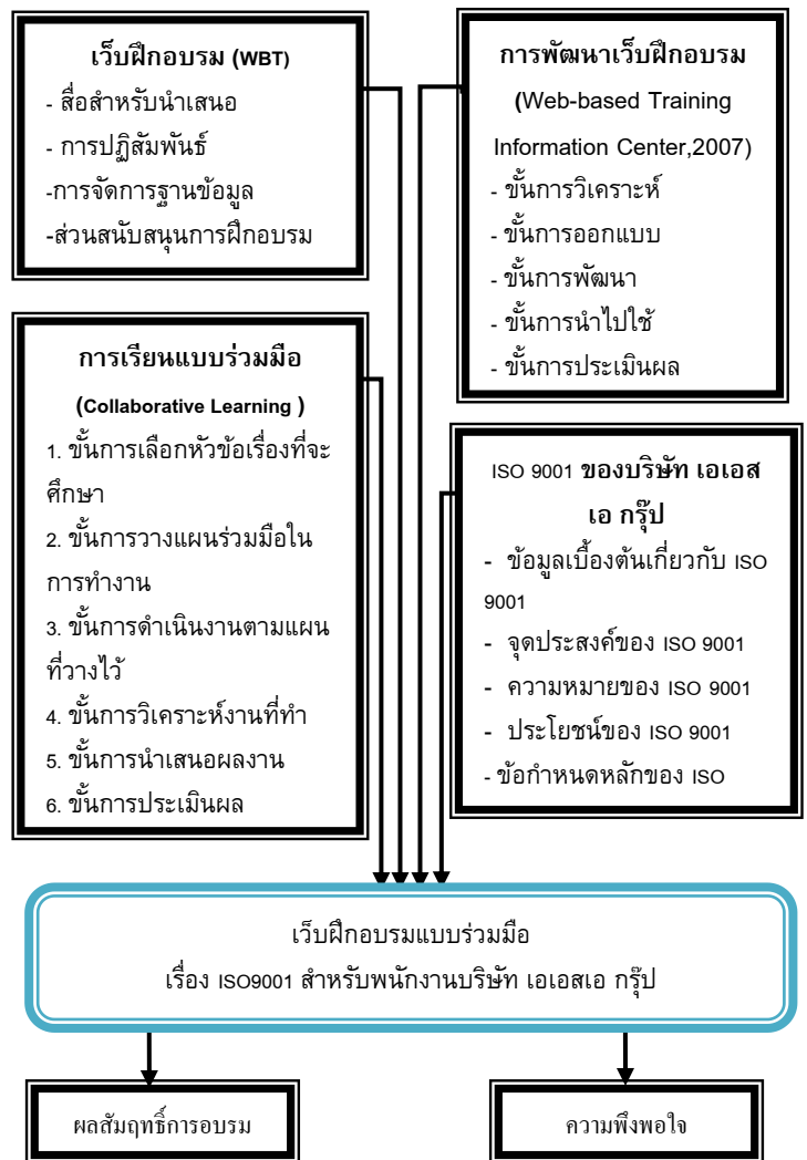
ภาพที่ 1 กรอบแนวคิด การฝึกอบรมแบบร่วมมือเรื่อง ISO9001สำหรับพนักงานบริษัท เอเอสเอ กรุ๊ป